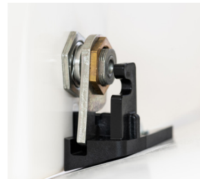
3 points de fixation sur la citerne 3 fixing points on the tank