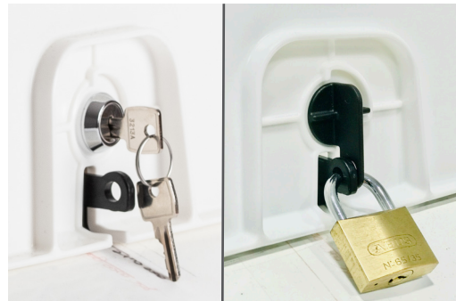
2 systèmes de verrouillage 2 locking systems