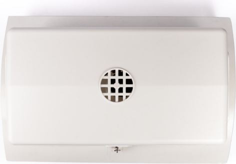
Cheminée de dégazage Degassing chimney