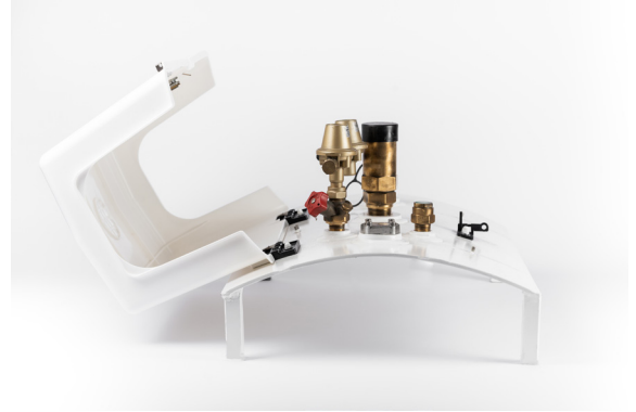
Charnières pivot incassables Unbreakable pivot hinges