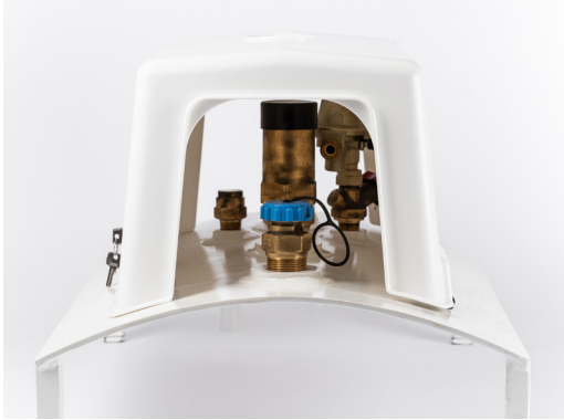
Grandes ouvertures Large openings